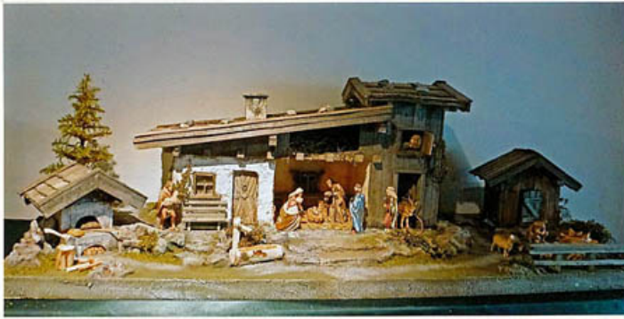
eine kleine Auswahl der heuer gebauten Krippen