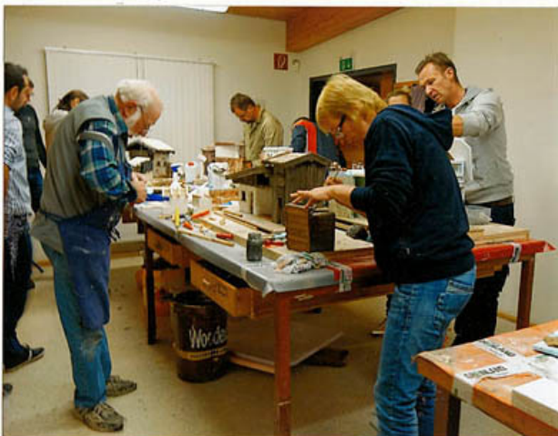
Krippenbaumeister geben Ratschläge – und helfen, wo es nötig ist