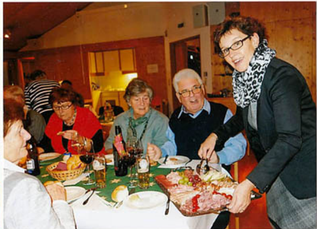
es wird serviert