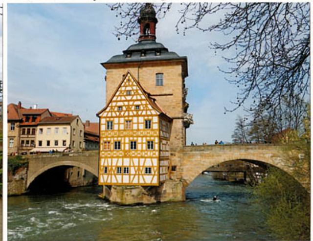
das „Alte Rathaus“