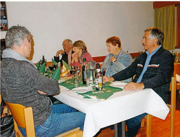
Gespräche und Fachsimpelerei