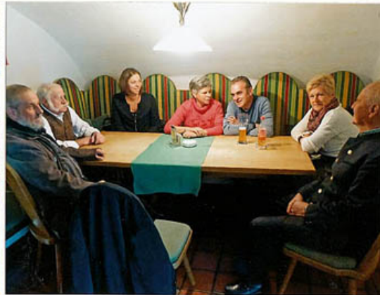
Die Völsler Abordnung, unser Obmann (der Fotograf) war natürlich auch dabei!