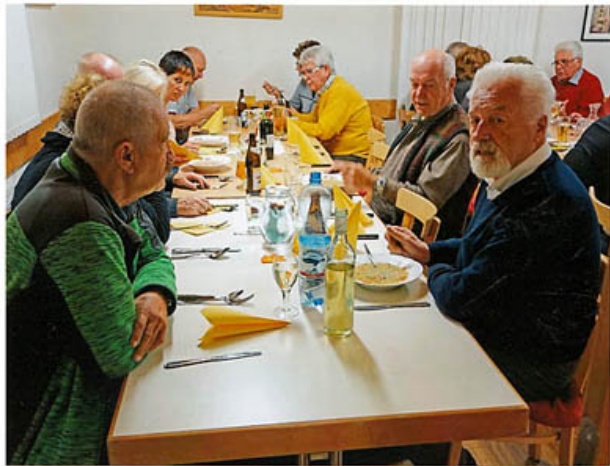
und es schmeckt