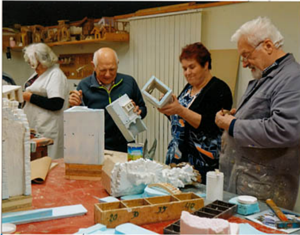
erste Teile werden konstruiert