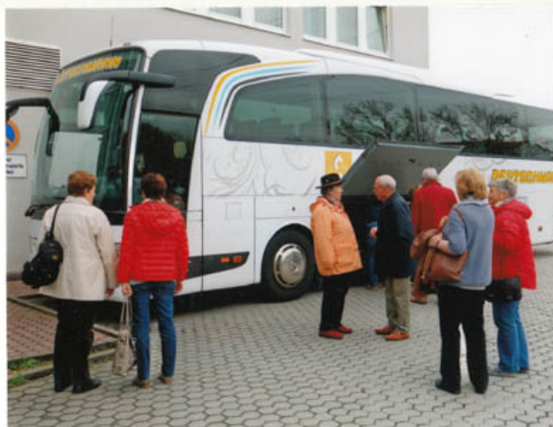
2.Tag - Abfahrt in die „Fränkische Schweiz“

Alljährlich werden zur Osterzeit Brunnen u. Quellen liebevoll mit ausgeblasenen, bemalten Eiern u. Girlanden geschmückt.