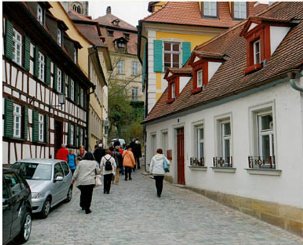
in der Altstadt