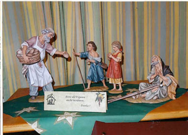
neue Figuren für unsere Kirchenkrippe