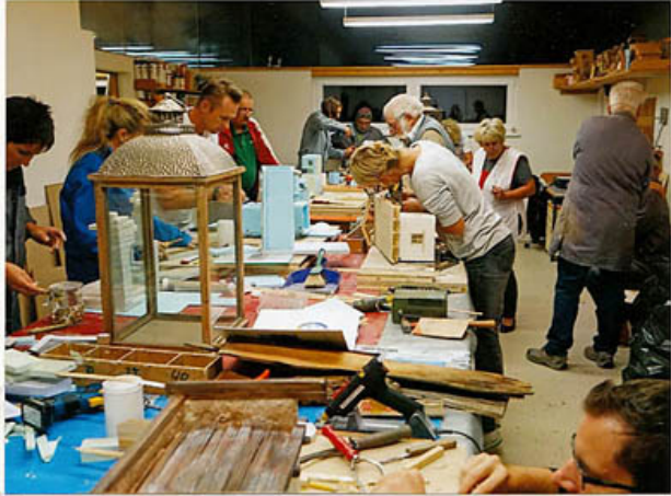
die ersten Rohbaulen stehen bereits