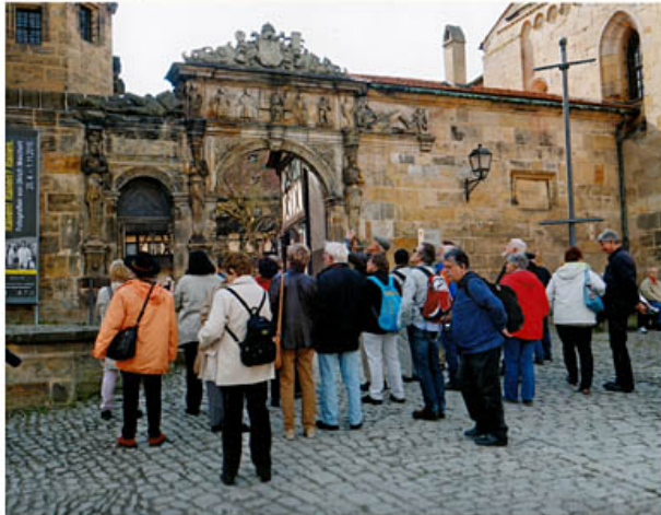
die „Schöne Pforte“