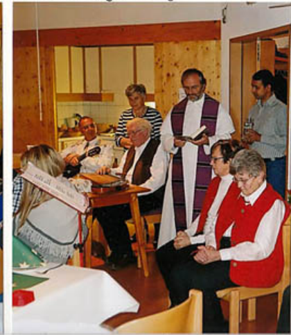
Kooperator Roi assistiert