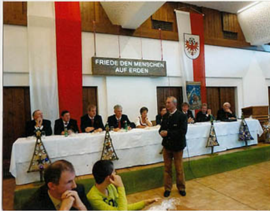
Heuer ein etwas früher Termin.