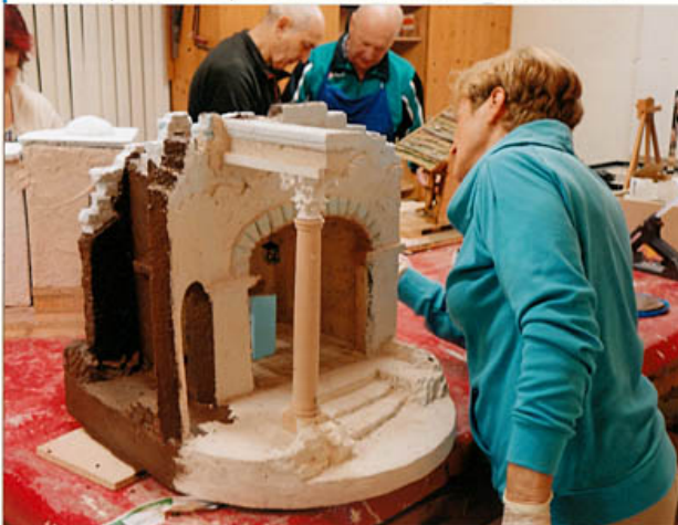
zwei fleißige Tempelbauerinnen