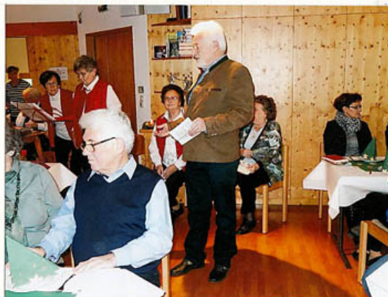
Begrüßung der Anwesenden und einführende Worte unseres Obmannes