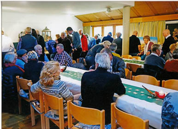
zeitweise gibt es starken Andrang