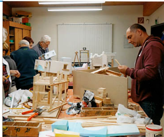
konzentriert bei der Arbeit