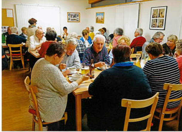
es ist serviert