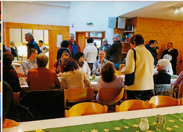
rasten bei Kaffee und Kuchen