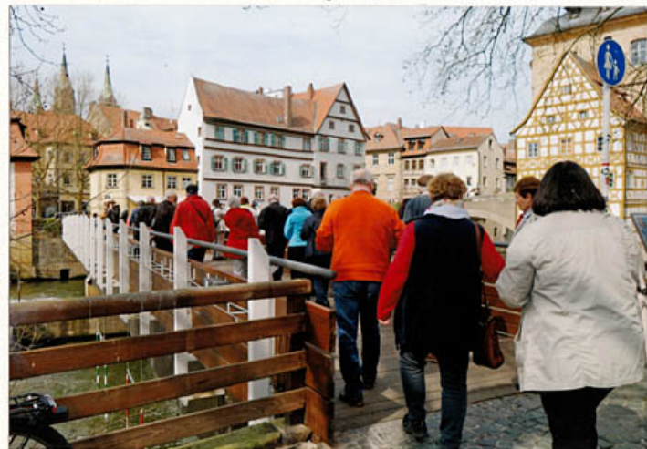
„Einzug“ in Bamberg