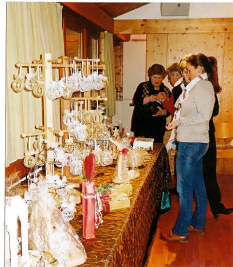
schöne Angebote am Bazar

Auf Grund der warmen Witterung wechselten heuer die Besucher zwischen dem gleichzeitig stattfindenden Christkindlmarkt und der Ausstellung nicht so häufig hin und her, wie in anderen Jahren. Trotzdem, wir sind mit der Besucherzahl zufrieden, die Ausstellung war wieder ein schöner Erfolg.