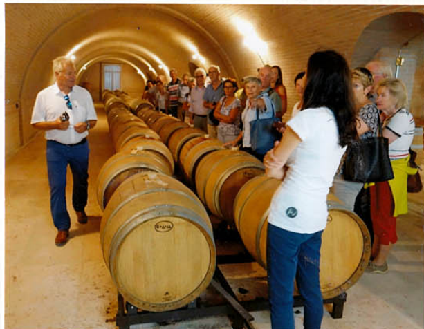
und wieder hinauf in den Weinkeller