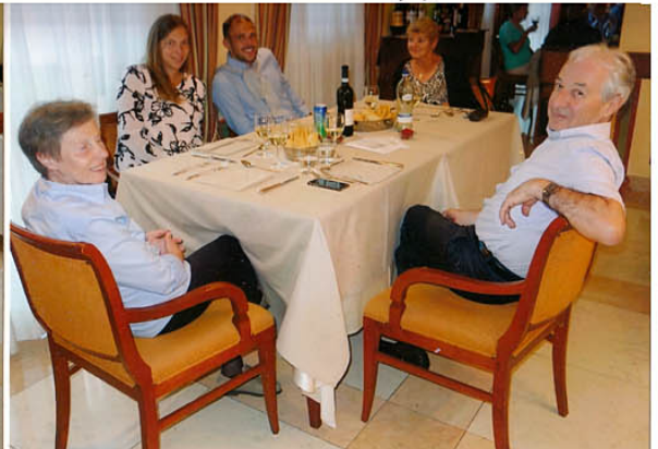
Zum Abendessen nochmals einen „Soave“ –