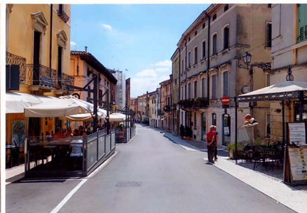
durch das Stadttor in die Hauptstraße von Soave