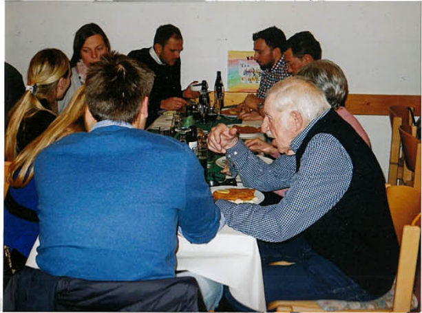
mit Geplauder, Fachsimpelerei - und zu guter Letzt -