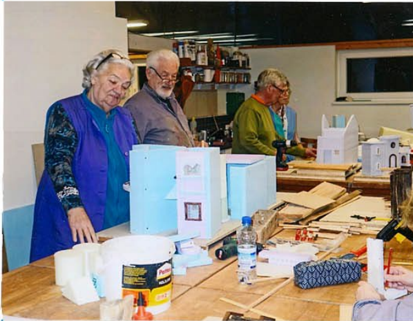
mit dem Fortschritt zufrieden