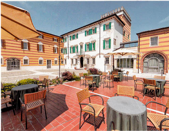
Hotel Villa Malaspina