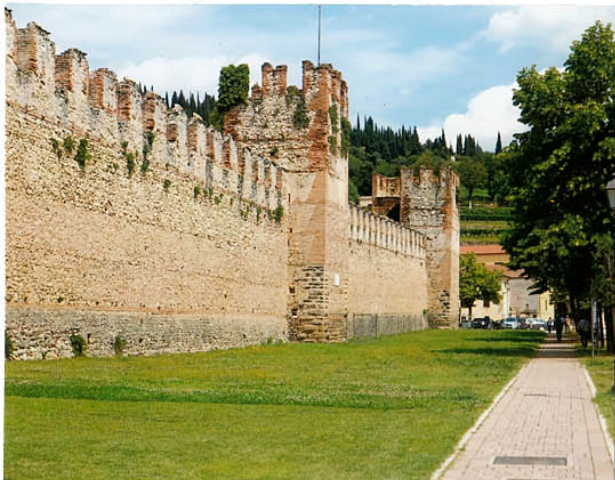
1 06 11