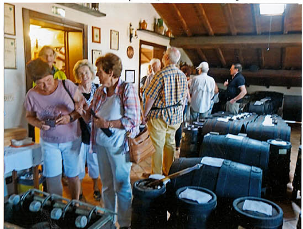
u. Mitte - das Fässchen mit der Kostprobe