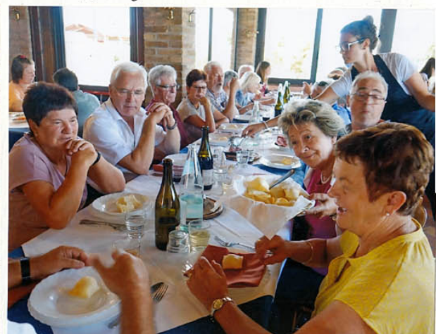
das Mittagsmahl - nach ca. 2 1/2 Stunden - Aufbruch nach Hause