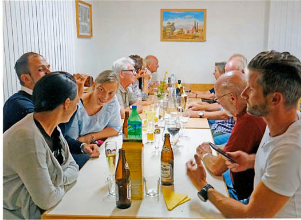
und dann der „Hoangart“