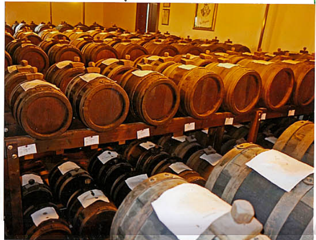
ein Teil des umfangreichen Lagers