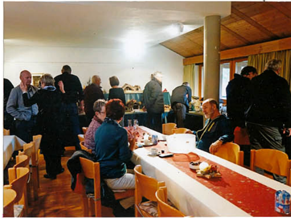
Krippenschaug'n und rasten