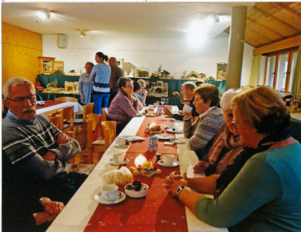
bei Kaffee und Kuchen