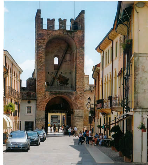
04 11 11