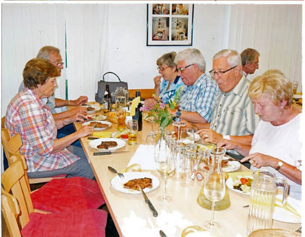
und genießen das Gebotene