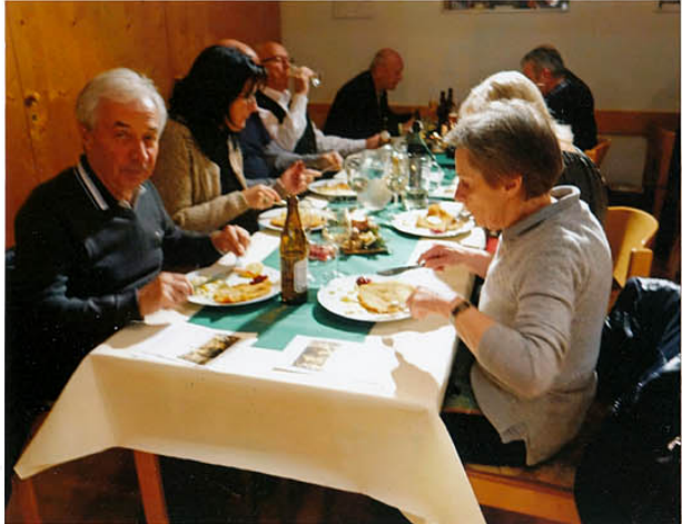
Nun kommt der gemütliche Teil, mit wohlschmeckender Stärkung,