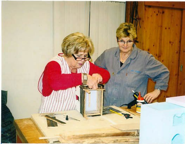
soweit nötig, wird Anleitung und Hilfe gegeben, bauen müssen sie aber selbst