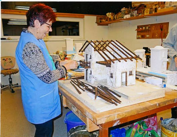
Balkongeländer ist Feinarbeit