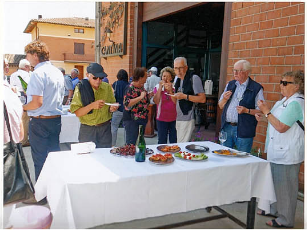
ein freundlicher Empfang