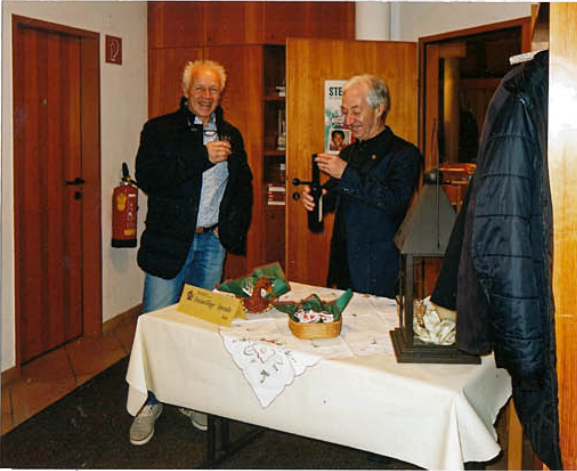
wie immer - ein freundlicher Empfang