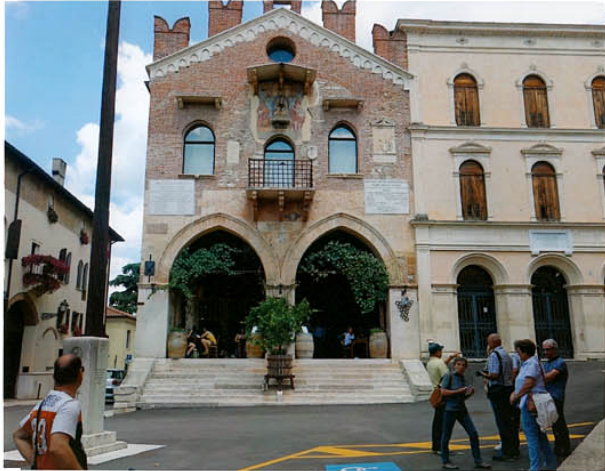
Wo wollen wir einkehren?