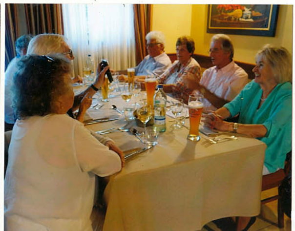
oder vorerst doch ein Bier?