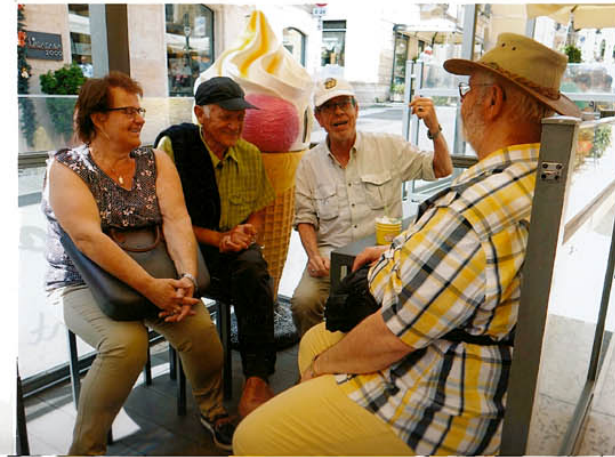
„Un gelato -eccetente“!