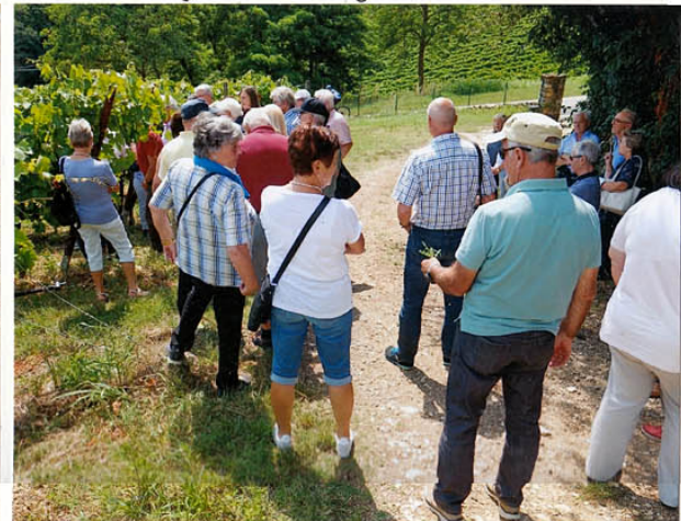
in den Weingarten