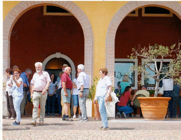
und gleich wieder den Berg hinunter