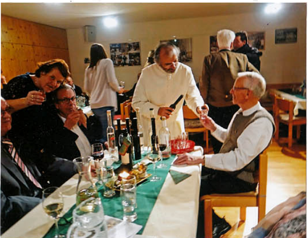
unser Pfarrer mit einem Korb voll „geistigem“ Zuspruch