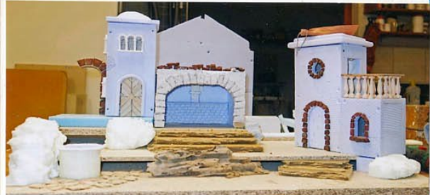
der Rohbau steht