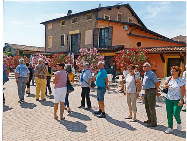
Ankunft bei „Leonardi“