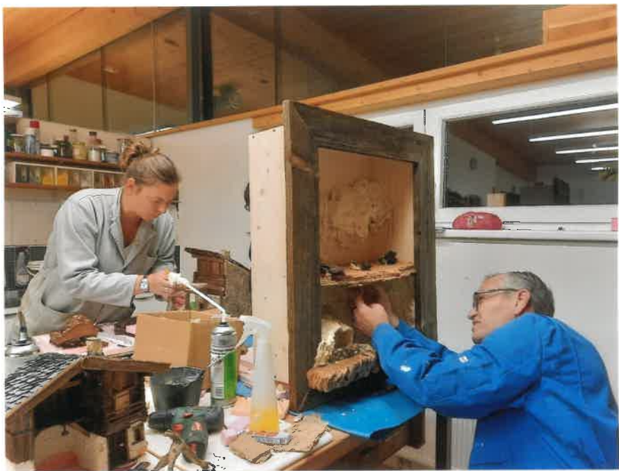
Kursende mit Abschlussfeier am 29.11.2022: