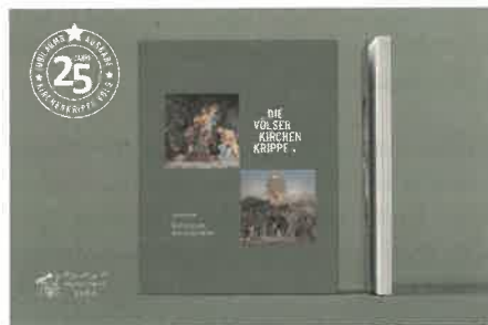
Jubiläumsausgabe 25-Jahre Kirchenkrippe Völs

Zum 25-jährigen Kirchenkrippen-Jubiläum wurde ein hochwertiger Bildband in limitierter Auflage angefertigt. Dieser ist ab 7. November 2022 für € 38,- erhältlich bei: Krippenverein Völs,