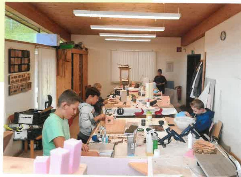
Krippenbaukurs für Kinder im Herbst 2022: